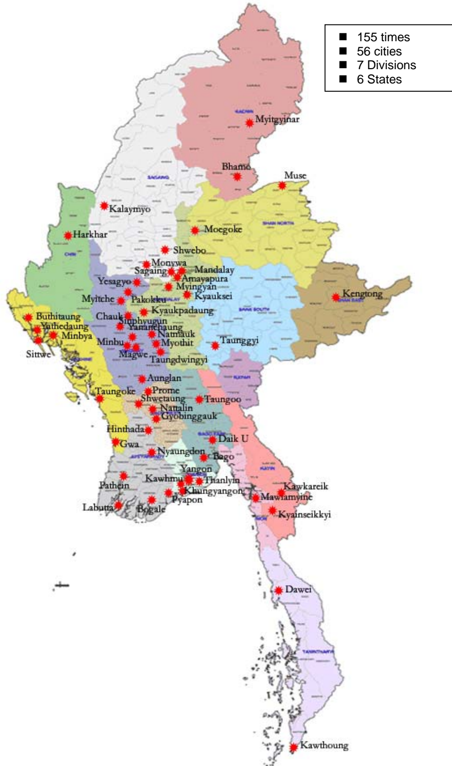
The Map of Peaceful Demonstrations (Since 17 Aug to 24 Sep, 2007)